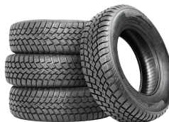
PNEUS ET PIÈCES AUTOMOBILES

Lieu de dépôt dans votre municipalité et certains garagistes