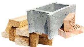
MATÉRIAUX DE CONSTRUCTION

Lieu de dépôt dans votre municipalité ou collectes (surveillez les dates)