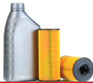
HUILES, FILTRES ET ANTIGELS